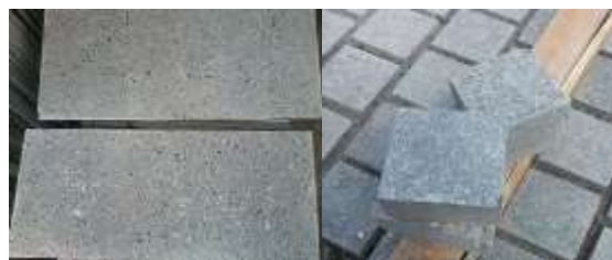
Gambar 1. Contoh Bentuk Batu Alam

Penggunaan etnomatematika pada penelitian ini yaitu dengan batu alam. Batu alam atau lebih dikenal sebagai batu-batuan merupakan benda keras yang banyak ditemui serta banyak digunakan sebagai bahan material bangunan atau sebagai dekorasi interior maupun eksterior. Batu alam banyak juga banyak didataran tinggi atau perbukitan. Jenis batu alam yang sering digunakan sebagai bahan material bangunan ataupun dekorasi interior maupun eksterior adalah jenis batu marmer, batu paras ( lime stone ), batu mulia dan batu kali (Hananto, 2006).